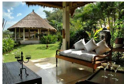
VILLA MATHIS ****(*) dès CHF 1'995.-