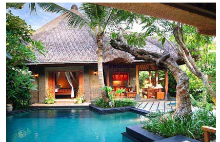
INTERCONTINENTAL ***** dès CHF 2'150.-